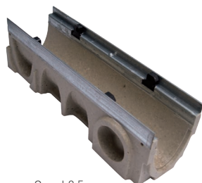
Canal 0,5 m.

* Saídas verticais exclusivamente sob pedido. **Seção em forma de U