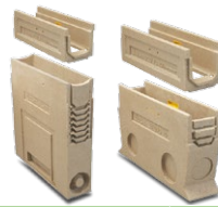
AOCULTO100S + AU100

El canal no dispone de rejilla por ser de una sola pieza.